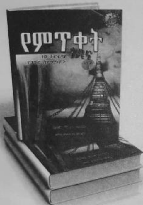
የምጥቀት ጎዳና 1