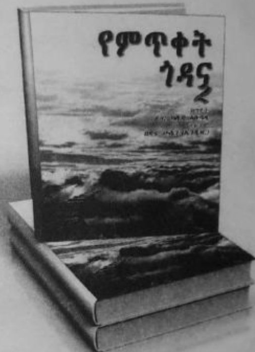
የምጥቀት ጎዳና 2