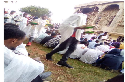
Fakkii 2: Mana Kiristiyaanaa WSU Waadduu Qusqu'aam Maariyaam.