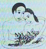
ኪዳነ አዳም ወሐዋን